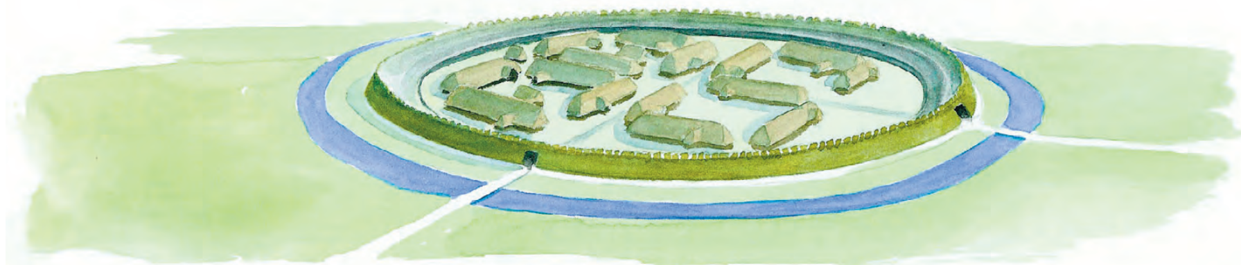
Ringborg fra Vikingetiden

Husene overlapper i tre tilfælde hinanden. I 1999 påvistes et smedeområde, der afgrænses af en koncentration af sodsværtede gruber. Et stort antal fundrige gruber blev udgravet med stor hjælp af lokale amatørarkæologer. Keramikmaterialet herfra viser sammen med hustyperne og de righoldige detektorfund, der også omfatter talrige mønter, at pladsen har været bebygget konti-